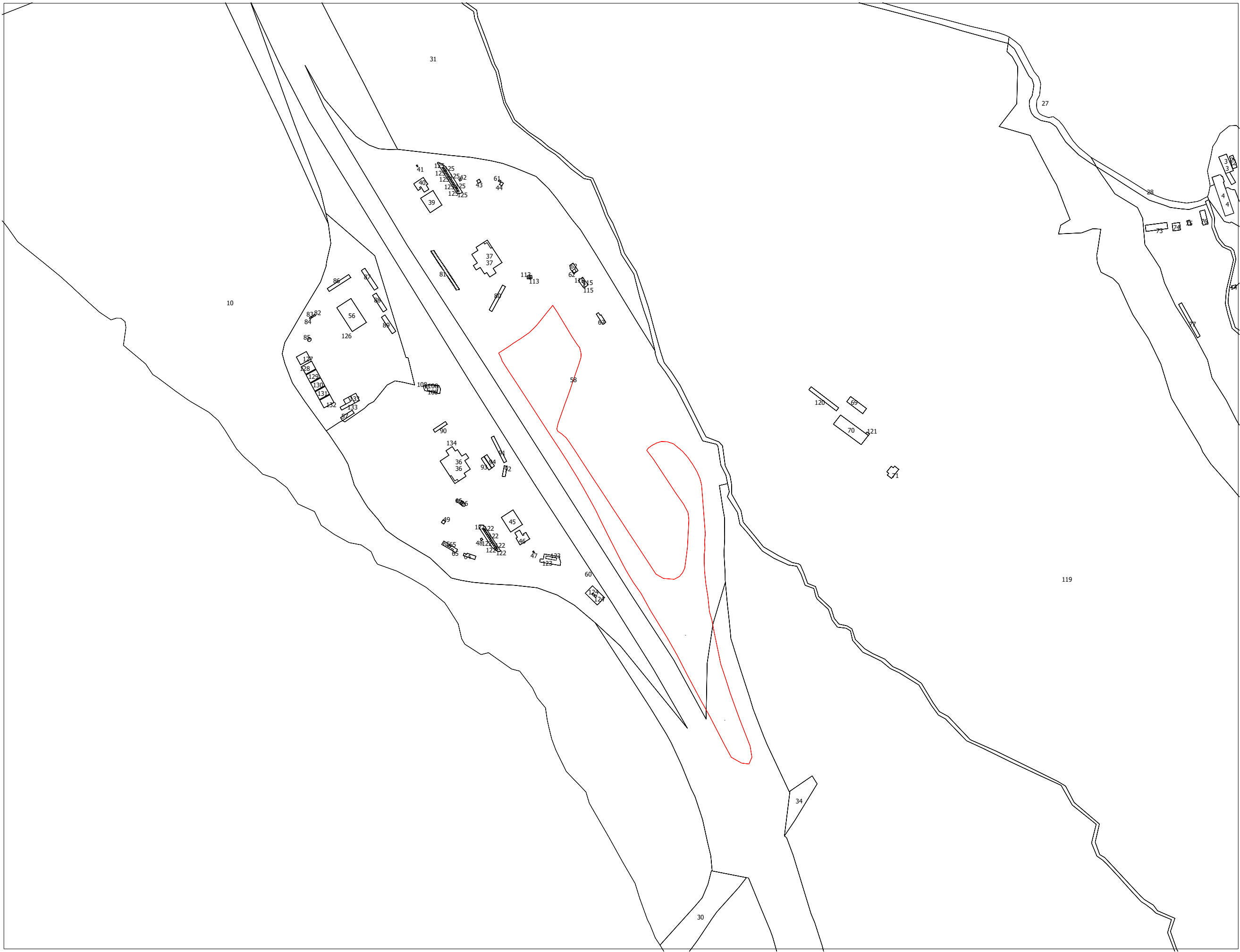
Inquadramento planimetrico su catasto (Foglio 5) | Scala 1:5000